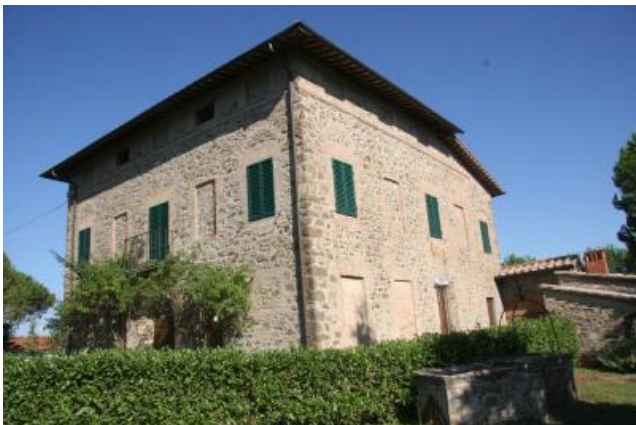
I locali adiacenti la cantina in loc Osservanza

comunali@bartoligiusti.it www.bartoligiusti.it