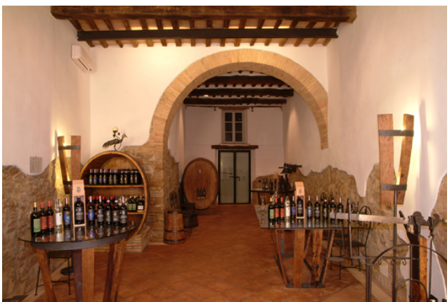
La vendita diretta nel centro storico di Montalcino